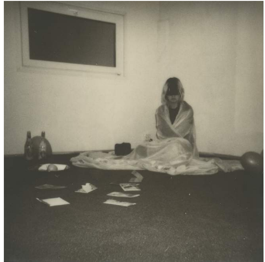
Dokumentatsioonifoto performance lt.