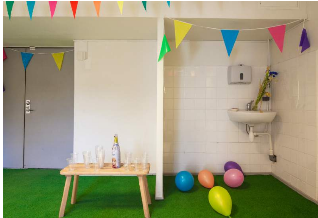
Dokumentatsioonifoto näituselt.