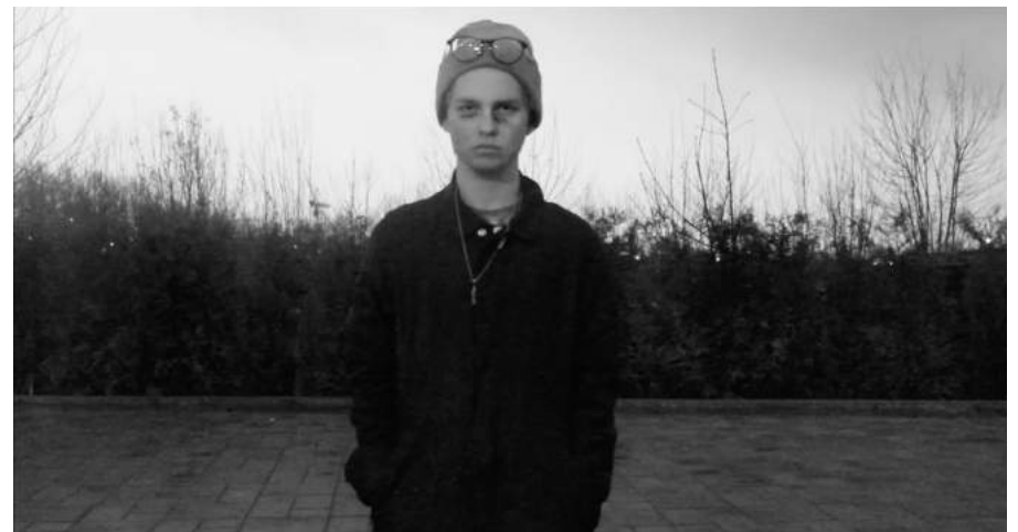
Ekraanitõmmised videost "Väide"