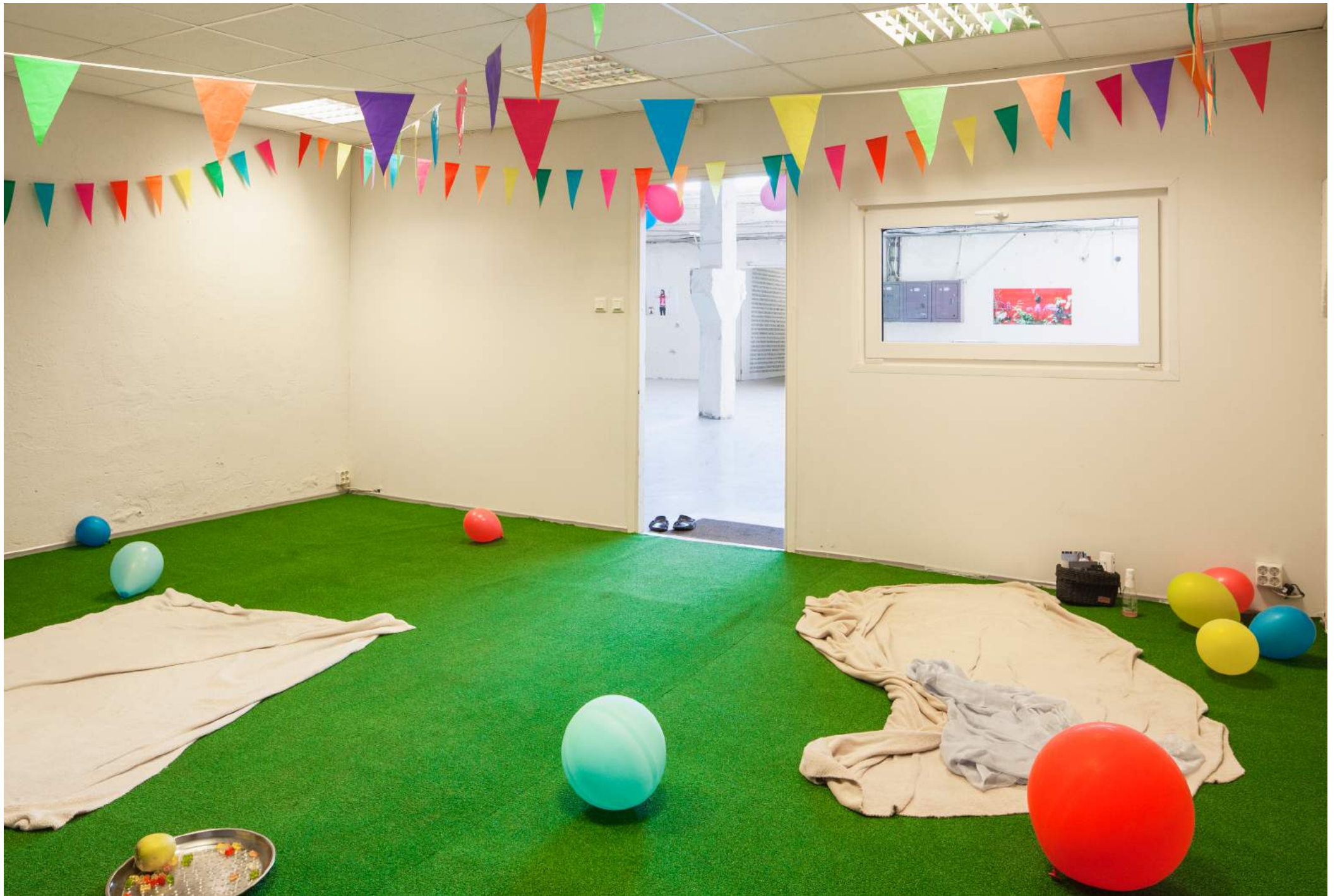
Dokumentatsioonifoto näituselt.