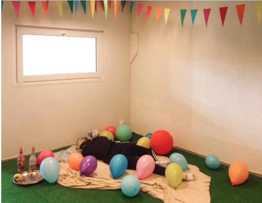
Dokumentatsioonifoto näituselt.