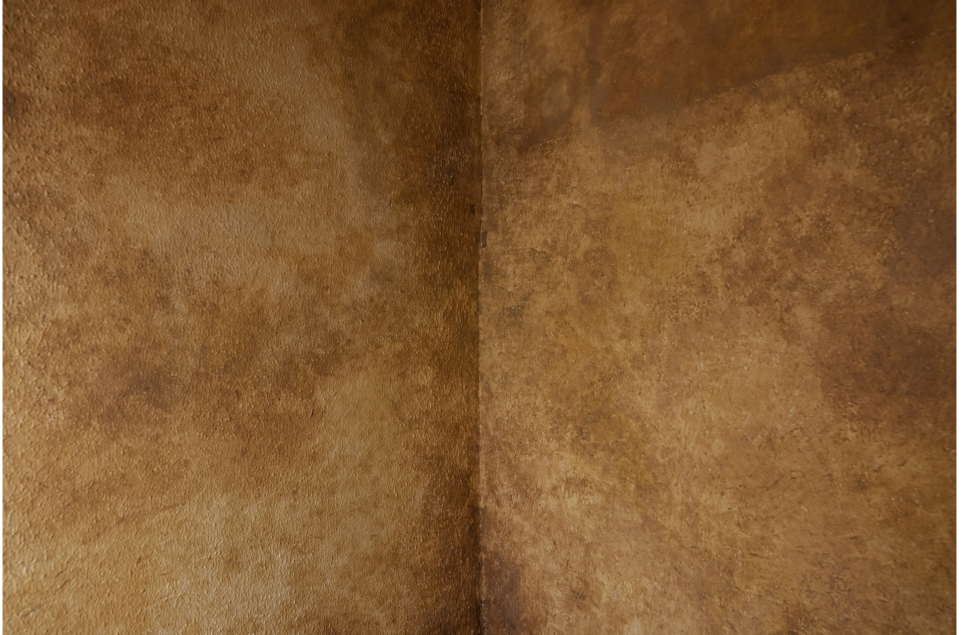
NUDES (2020) - Detailivaade