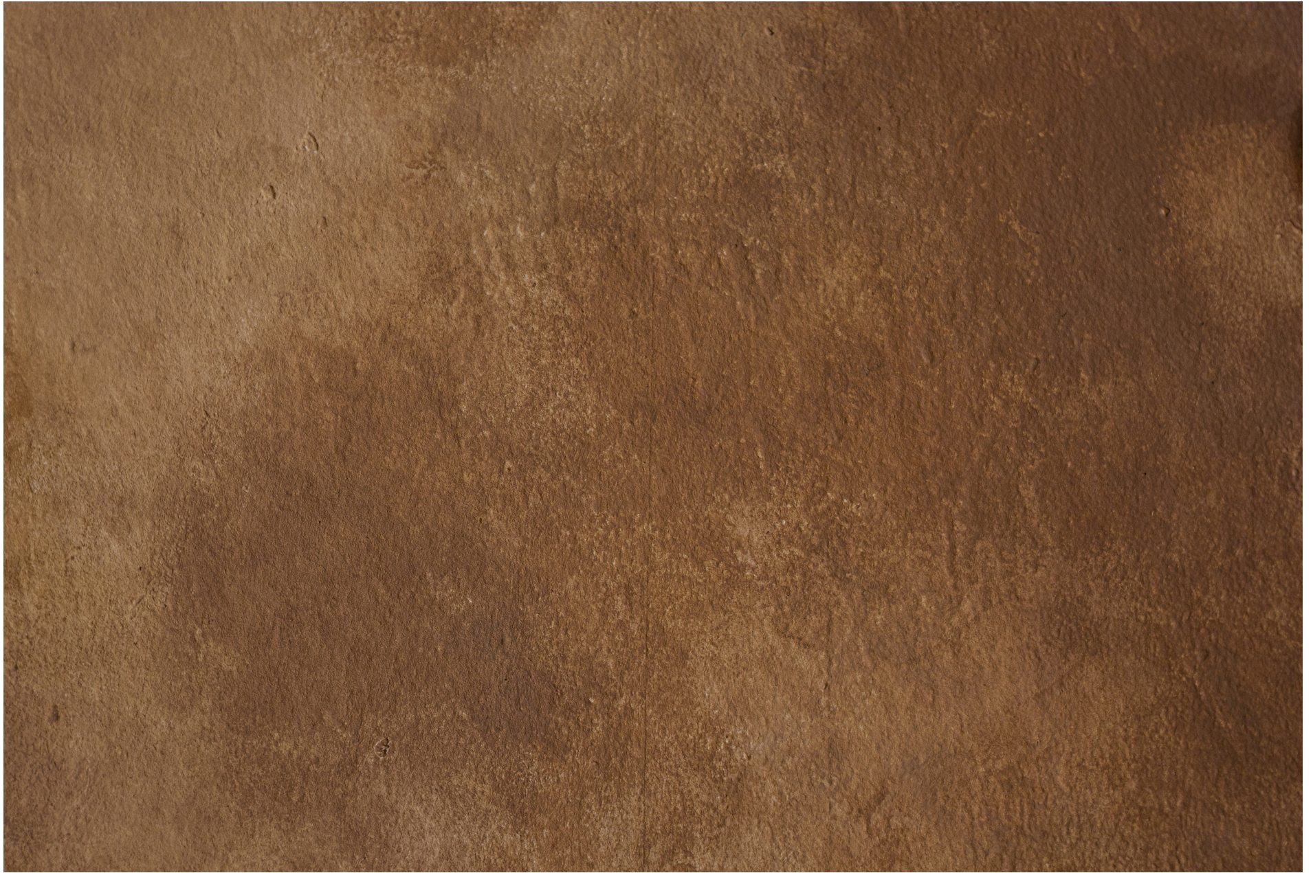
NUDES (2020) - Detailivaade