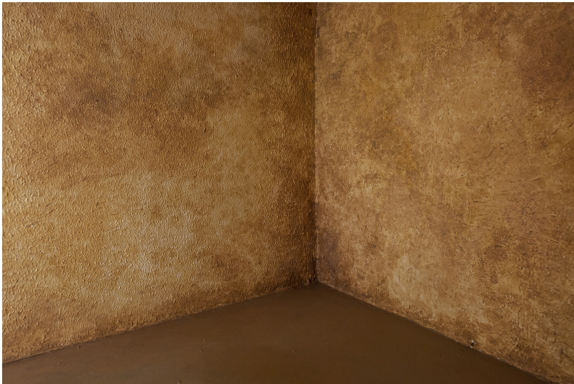
NUDES (2020) - Detailivaade