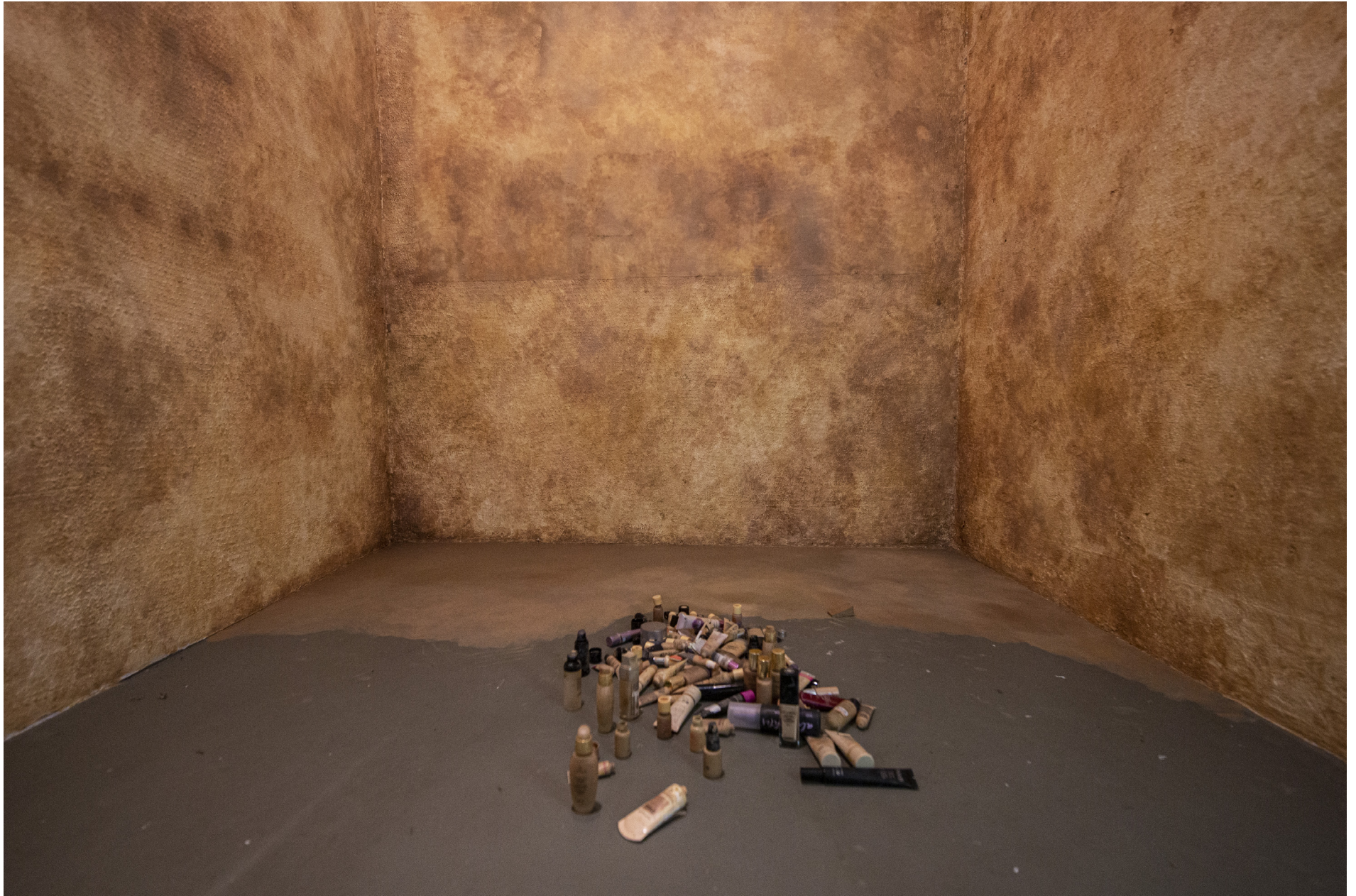
NUDES (2020) - Ruumivaade