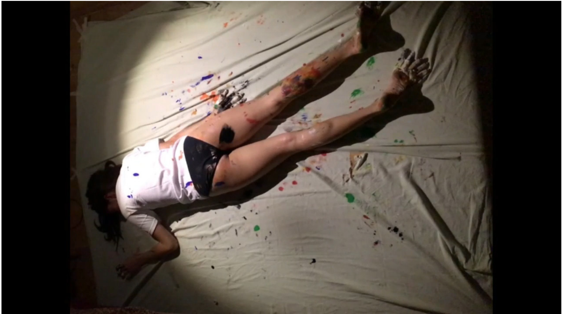
Kaader videoteosest. (2016)