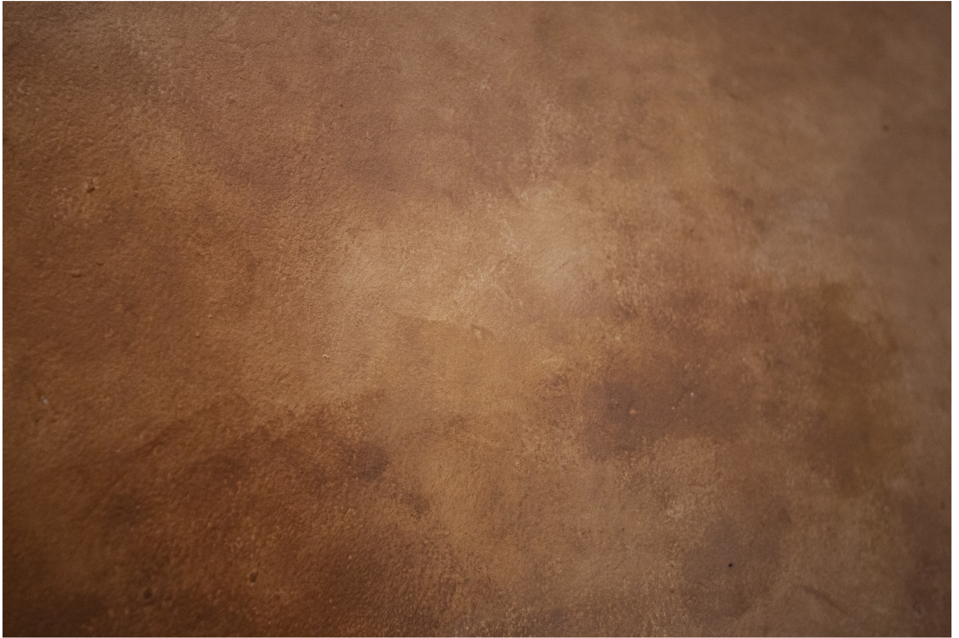
NUDES (2020) - Detailivaade